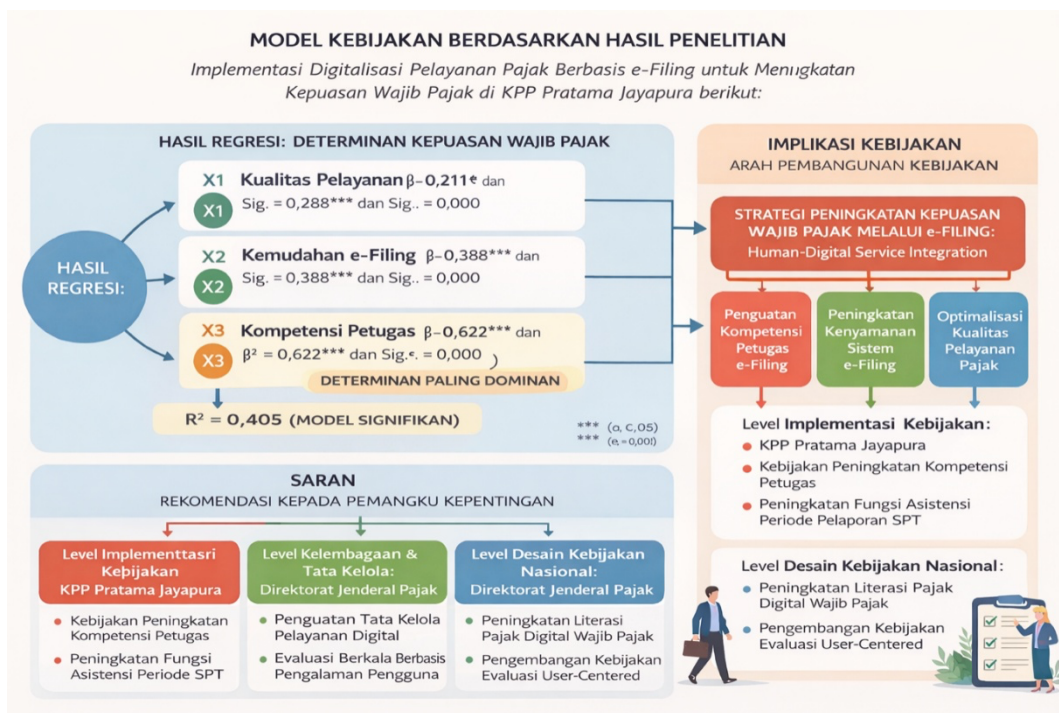
Gambar 3. Model Kebijakan Implementasi Digitalisasi Pelayanan Pajak Berbasis e-Filing dalam Meningkatkan Kepuasan Wajib Pajak di KPP Pratama Jayapura