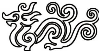
Gambar 2. Motif Warak Ngendog

Tahap eksplorasi desain menghasilkan beberapa percobaan pengembangan motif batik. Percobaan pertama menghasilkan komposisi motif yang masih cukup kompleks sehingga dilakukan evaluasi terhadap keseimbangan visual, ritme motif, serta keterbacaan bentuk saat diaplikasikan pada kain. Berdasarkan evaluasi tersebut, dilakukan