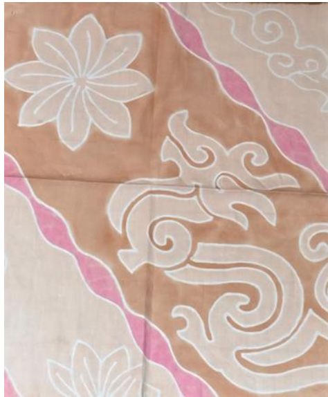
Gambar 7 Swatches Motif Batik

Dalam proses perancangan, diterapkan pula prinsip desain berupa repetition melalui pengulangan motif batik dan susunan kelopak lotus, unity melalui keselarasan antara siluet, warna, material, motif, dan detail dekoratif, serta center of interest yang difokuskan pada motif batik dan detail 3D flower sebagai elemen visual utama. Tahap prototype dilakukan melalui aplikasi motif menggunakan teknik batik tulis yang dipadukan dengan detail 3D flower bunga teratai untuk menambah dimensi visual dan memperkuat kesan eksklusif pada busana.