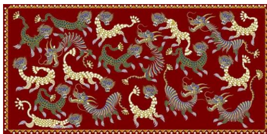
Gambar 4. Batik Warak Ngendog

Proses perancangan dilakukan menggunakan metode Design Thinking yang diawali pada tahap empathize dengan memahami potensi visual Pagoda Avalokitesvara yang masih kurang terekspos serta Warak Ngendog yang memiliki nilai filosofis kuat namun belum banyak diangkat ke dalam desain fashion kontemporer. Tahap define dilakukan dengan menetapkan elemen utama berupa bentuk atap pagoda bertingkat, struktur segi delapan dari perspektif atas, ornamen arsitektural, Warak Ngendog , serta bunga teratai sebagai sumber inspirasi visual utama. Selanjutnya pada tahap ideate , dilakukan analisis visual dan eksplorasi bentuk melalui tabel pengembangan desain dengan mentransformasikan bentuk asli pagoda menjadi elemen motif yang lebih sederhana, modern, dan aplikatif. Pada tahap ini, elemen Warak Ngendog juga mengalami stilasi