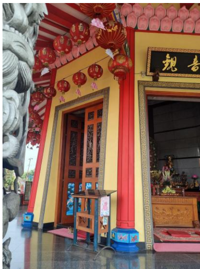
Gambar 3. Pagoda Avalokitesvara bagian dalam