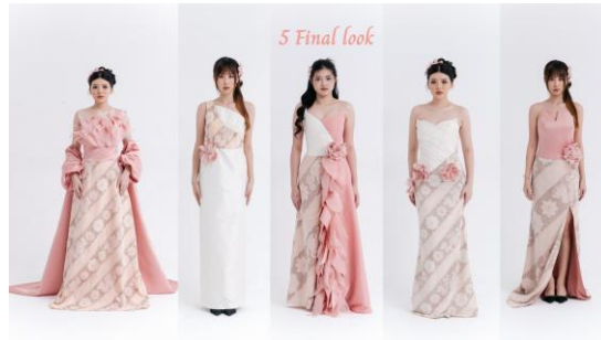
Gambar 11. 5 Final Look Hasil

Avalokitesvara dan Warak Ngendog sebagai identitas utama desain. Pada tahap test, dilakukan evaluasi akhir untuk memastikan kesesuaian konsep budaya, nilai estetika, fungsi busana, serta keberhasilan desain dalam merepresentasikan identitas budaya lokal Semarang ke dalam karya fashion kontemporer.