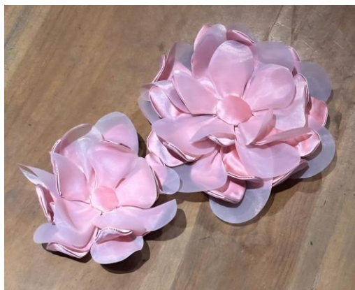
Gambar 8 Swatches 3D Flower Lotus