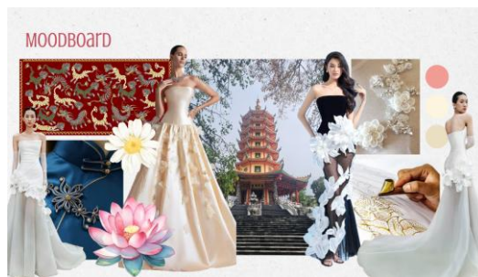
Gambar 9. Moodboard Serenity in Harmony

Proses perancangan kemudian dilanjutkan dengan penyusunan moodboard sebagai acuan visual dalam menentukan arah desain secara keseluruhan, meliputi referensi siluet, warna, detail ornamen, material, serta elemen dekoratif yang digunakan pada koleksi. Berdasarkan moodboard tersebut, dilakukan eksplorasi beberapa alternatif desain hingga menghasilkan 5 final look dalam bentuk sketsa desain sebagai representasi pengembangan konsep visual.