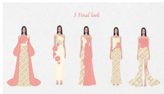
Gambar 10. 5 Final Look Sketch