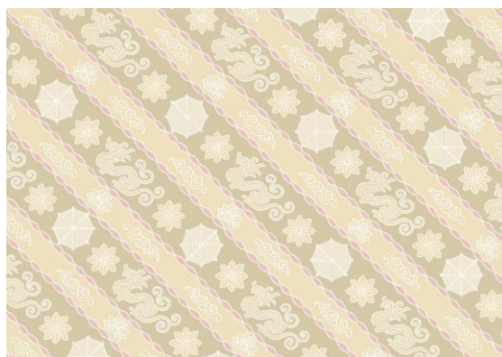
Gambar 6. Percobaan Motif 2