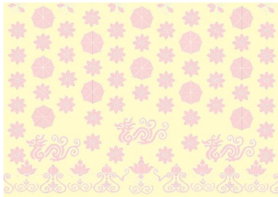
Gambar 5 Percobaan Motif 1

pengembangan ulang pada percobaan kedua melalui penyederhanaan bentuk, pengaturan jarak antar motif, serta penyusunan komposisi yang lebih harmonis hingga diperoleh motif final yang sesuai dengan karakter desain. Hasil pengembangan tersebut kemudian diimplementasikan melalui penerapan elemen desain, yaitu garis vertikal dan garis lengkung yang memberikan kesan elegan dan feminin, penggunaan siluet A-line dan I-line untuk menciptakan karakter anggun dan modern, kombinasi warna putih gading dan pink yang merepresentasikan kesan mewah sekaligus feminin, serta penggunaan ornamen 3D flower berukuran besar sebagai point of interest pada busana.