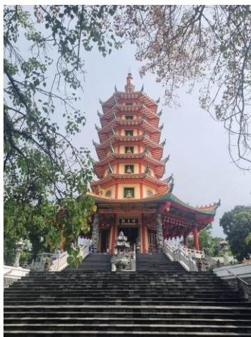
Gambar 1. Pagoda Avalokitesvara

serta hadirnya berbagai warisan budaya dan religi yang berkembang di kota ini. Menurut Kurniawan et al. (2022), kondisi tersebut tidak terlepas dari sejarah Semarang sebagai kota pesisir yang sejak lama menjadi pusat perdagangan dan pertemuan berbagai kelompok masyarakat. Salah satu bentuk keberagaman tersebut dapat dilihat melalui keberadaan yang dikenal sebagai ikon wisata religi Buddha dengan nilai historis, spiritual, sekaligus nilai estetika melalui arsitektur yang dipengaruhi unsur budaya Tiongkok dan Thailand (Afif & Pigawati, 2017).