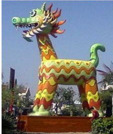
Gambar 2. Warak Ngendog

Berdasarkan hal tersebut, penelitian ini berfokus pada eksplorasi visual Pagoda Avalokitesvara dan Warak Ngendog sebagai sumber inspirasi dalam pengembangan motif batik kontemporer yang kemudian diterapkan pada perancangan busana evening wear . Pemilihan evening wear didasarkan pada karakteristik desainnya yang menonjolkan kesan elegan, detail dekoratif, dan nilai estetika yang sesuai dengan karakter visual kedua objek tersebut. Menurut Putri Amanda et al. (2023), evening gown merupakan jenis busana pesta yang mengedepankan kemewahan serta eksplorasi detail sebagai elemen utama desain. Melalui penerapan teknik batik tulis dan detail 3D flower , perancangan ini diharapkan dapat menghasilkan karya fashion yang tetap berakar pada budaya lokal Semarang dengan pendekatan desain yang lebih modern.