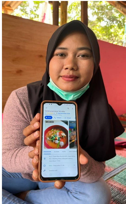
Gambar 6. Marketing