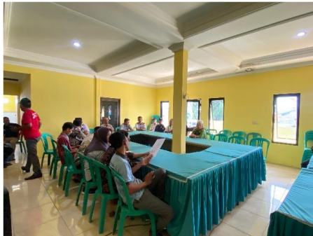
Gambar 1. Sesi penyampaian materi