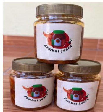
Gambar 4. foto produk sambal cumi