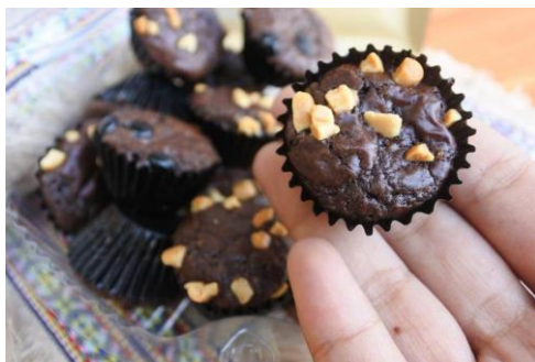
Gambar 3. Foto produk Brownies Chips