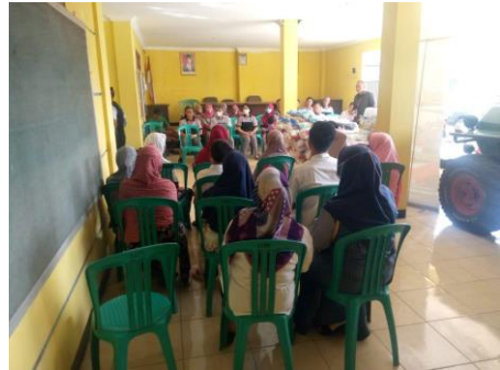
Gambar 2. Sesi penutupan materi