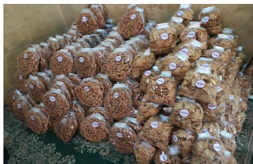
Gambar 7. Foto produk akar kelapa